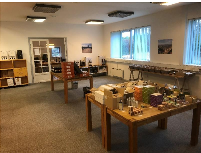
Storkontor ca. 9 x 7,5 meter. Indgang via vindfang/entre. Fra storkontor adgang til øvrige rum.