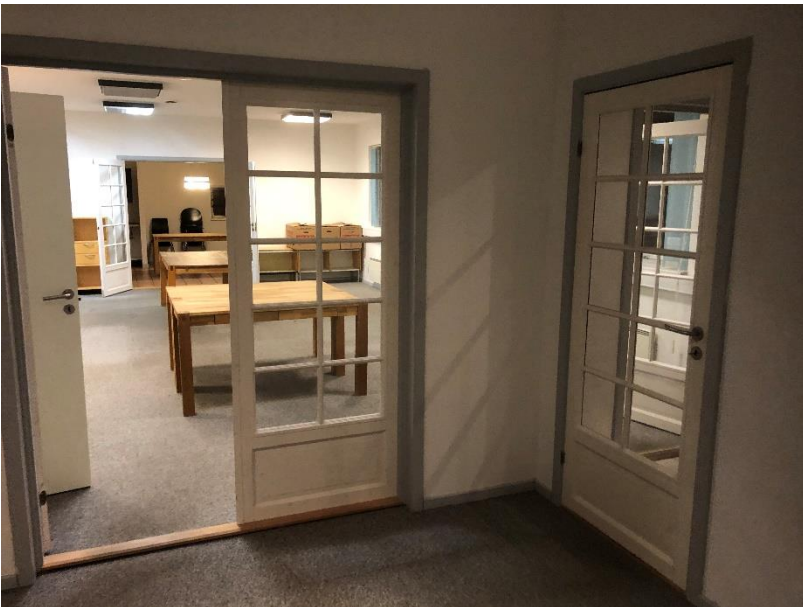
Forkontor, adgang fra vindfang/entre og dobbeltdør mod storkontor